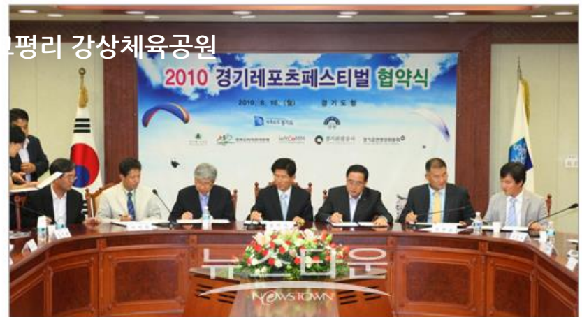
▲ 2010경기레포츠페스티벌 in양평 협약체결식 김문수 경기지사와 김선교 양평군수 등 관계자들이 16일 경기도청에서 '경기레포츠 성공개회를 위한 공동업무협정(MOU)'을 체결하고 있다.